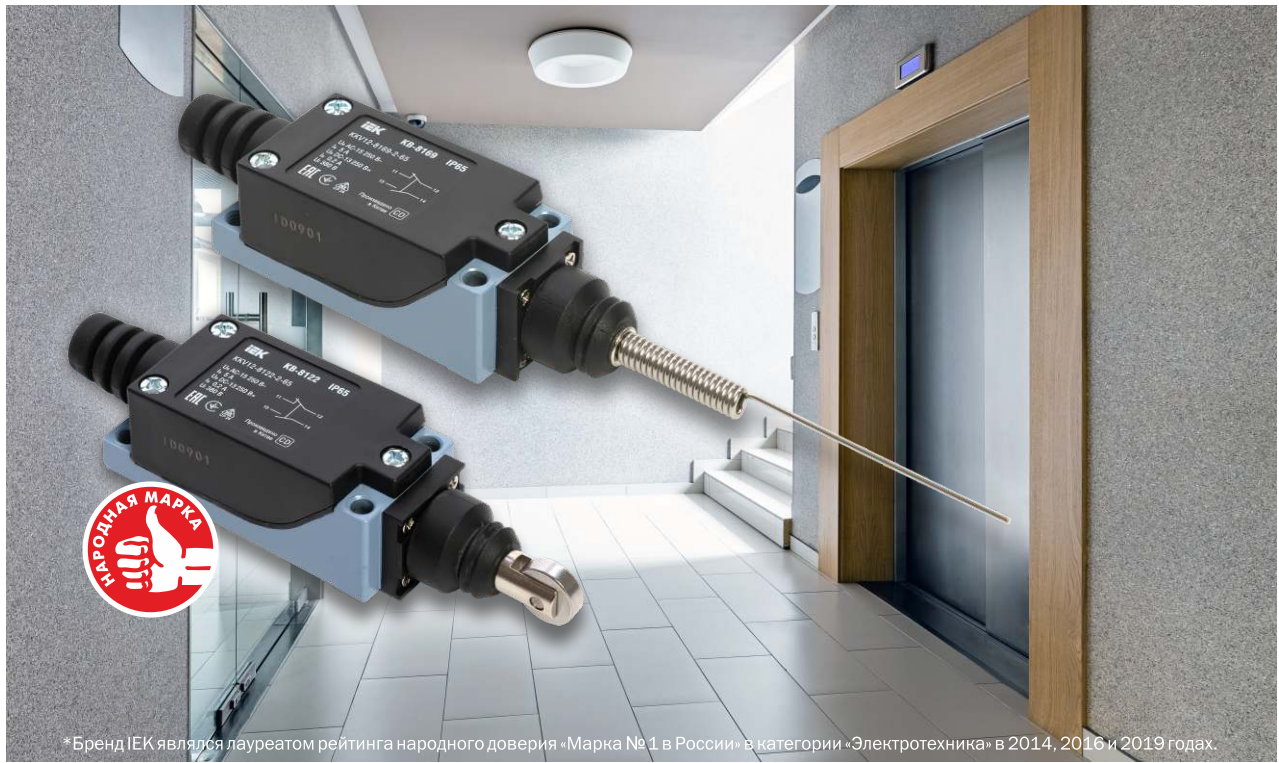
*Бренд IEK являлся лауреатом рейтинга народного доверия «Марка №1 в России» в категории «Электротехника» в 2014, 2016 и 2019 годах.

Соответствуют требованиям ТР ТС 004/2011 и ГОСТ IEC 609475-1.