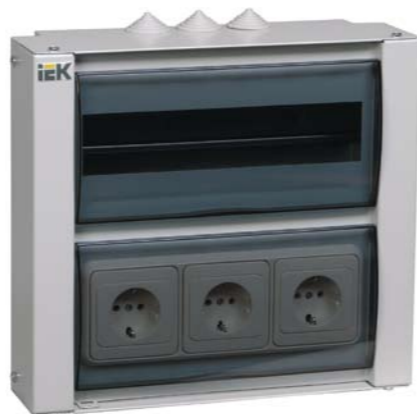
Корпуса учета и распределения с возможностью монтажа электроустановочных изделий

значенный для присоединения внешних и внутренних защитных проводников.